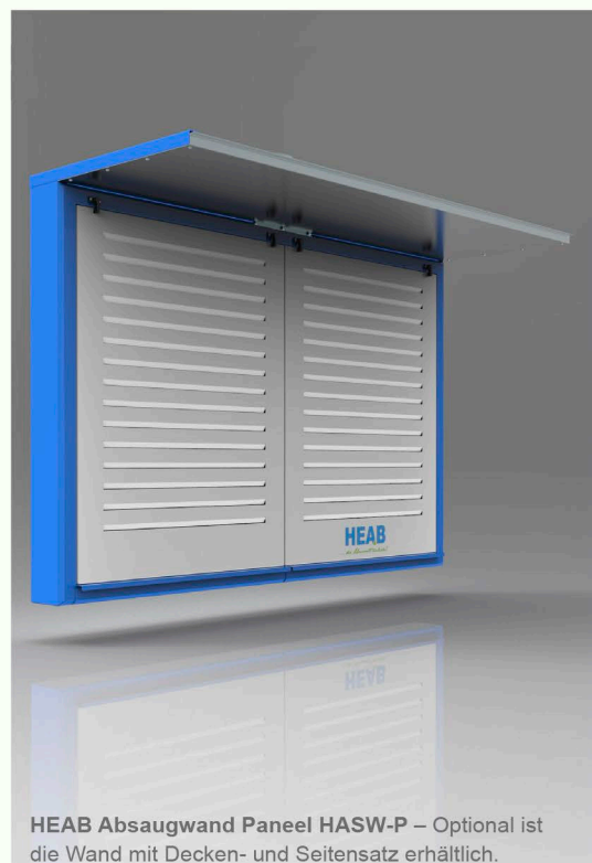
HEAB Absaugwand Paneel HASW-P – Optional ist die Wand mit Decken- und Seitensatz erhältlich.