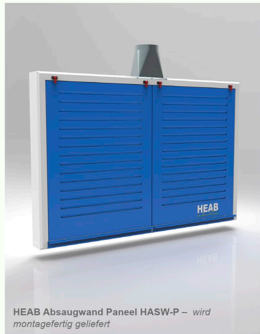
HEAB Absaugwand Paneel HASW-P – wird montagefertig geliefert

Die HEAB Absaugwand ist besonders als Schleifwand bei Schleifen mit Winkelschleifer und Exzentrerschleifer geeignet. Das Paneel ist so aufgebaut, dass die Luft über die Saugfläche verteilt wird. Die Saugfläche ist mit Stahllamellen ausgeführt. Optional ist die HEAB Absaugwand mit Decken- und Seitensatz erhältlich.